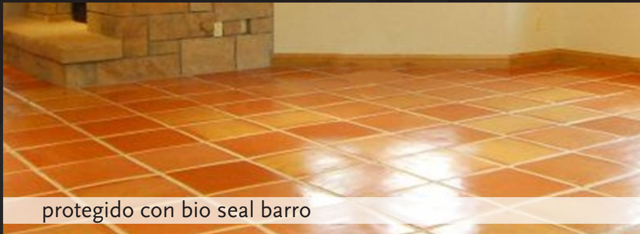
protegido con bio seal barro