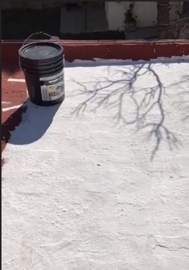
NANOFLEX aplicado en azotea.